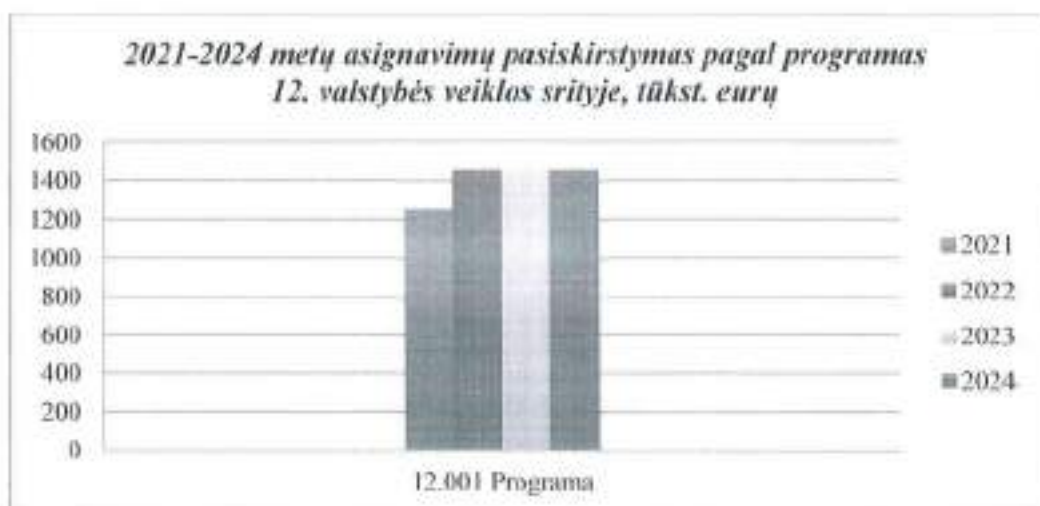
I grafikas. 2021–2024 metų asignavimų pasiskirstymas pagal programas

12 valstybės veiklos srities 12.001 programa (Inovatyvių gamtos, medicinos ir sveikatos sričių mokslinių tyrimų ir bendradarbiavimo su verslu plėtojimas, mokslininkų ir aukščiausiosios kvalifikacijos specialistų rengimas)